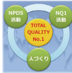
■ NSK品質保証の三本柱

NSKグループは、品質をコアバリューの一つと位置づけています。また2026年までに実現すべき目標として「品質保証ビジョン2026」を策定し、「お客様第一」の「100%の良品」を目指しています。部門協働で一貫した、かつシームレスな品質向上に取り組み、Total Quality No.1を実現します。