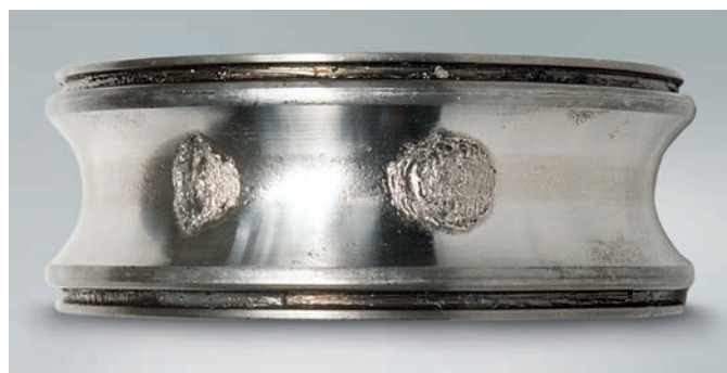
Typischer Ermüdungsschaden: Kleine, flache Teilchen lösen sich vom Lagerwerkstoff (Pittingbildung).